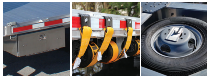
Schránka Boční navijecí pásy Rezervní kolo