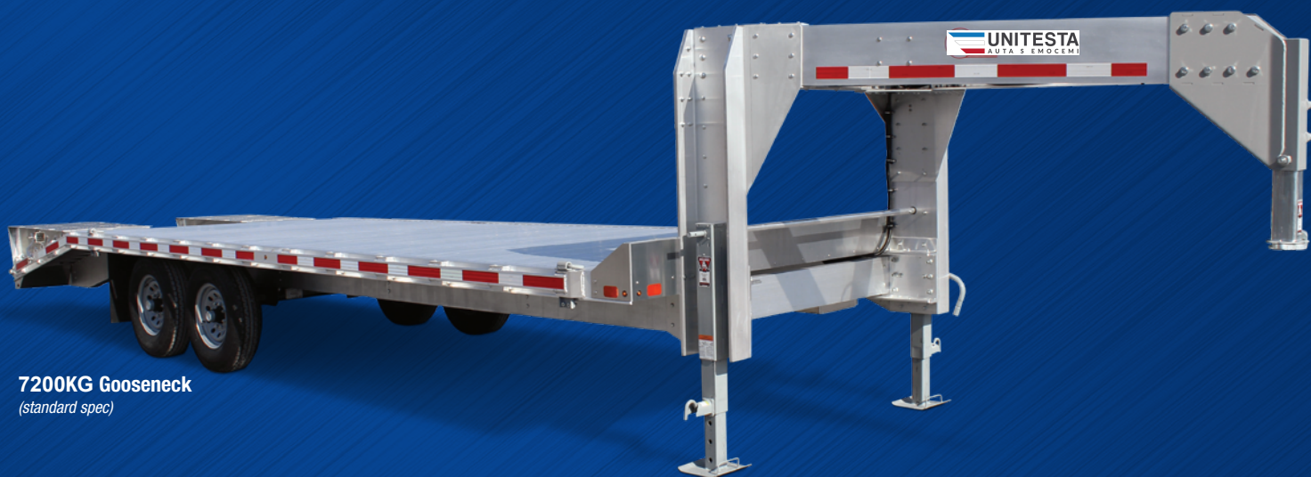
7200KG Gooseneck (standard spec)